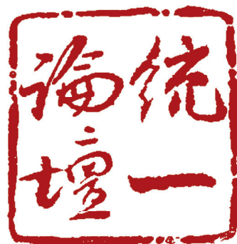
《统一论坛》集孙中山先生之墨宝