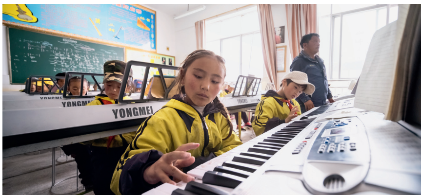
西藏拉萨当雄县龙仁乡中心小学学生正在上音乐课

能——内地西藏班35年35人口述史》后记中，作者丹臻群佩写到一个政策，一本通知书，十二三岁，二十多座城市，三十五年春秋，十几万人……内地西藏班的意义可能已经超过了“异乡求学”本身，俨然成为几代人共同的精神家园。