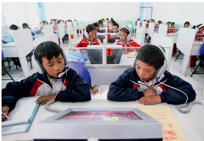
2007年9月21日，西藏自治区浪卡子县中学学生在语音室内上英语课