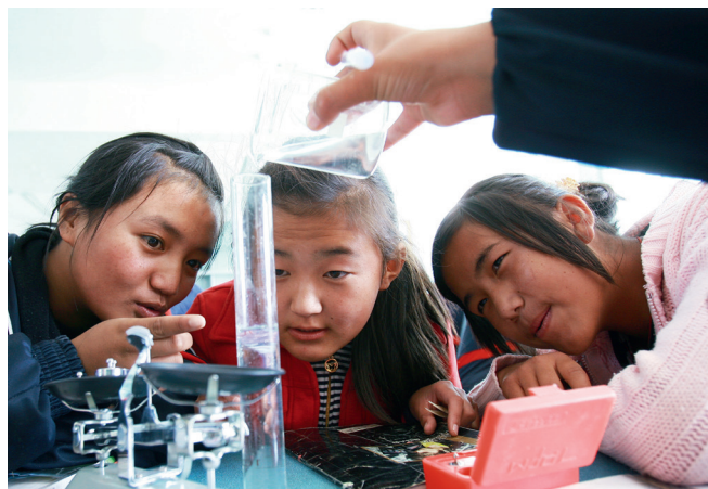
西藏日喀则地区上海实验学校化学课堂上，学生在认真做实验

在优先位置，加大公共财政对教育的投入力度，制定出台了系列教育惠民政策，着力解决学生“愿上学”“能上学”“上好学”问题。